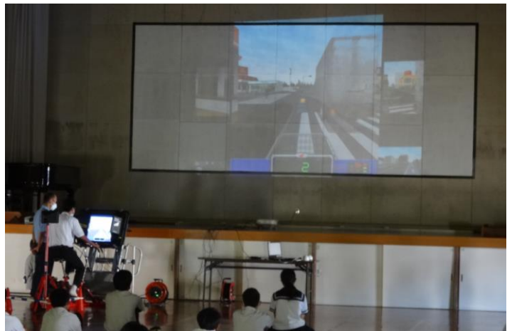
自転車シミュレーターを体験。体育館スクリーンに投影

事故を起こさない、事故に遭わないようにすることはもちろん、事故後の対応も重要です。